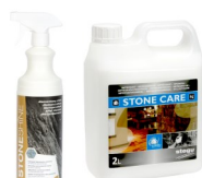
STONE SHINE / STONE CARE