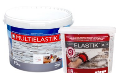
MULTIELASTIK / POWERELASTIK